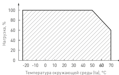
Рис. 2. Максимальная допустимая нагрузка, % от мощности источника.